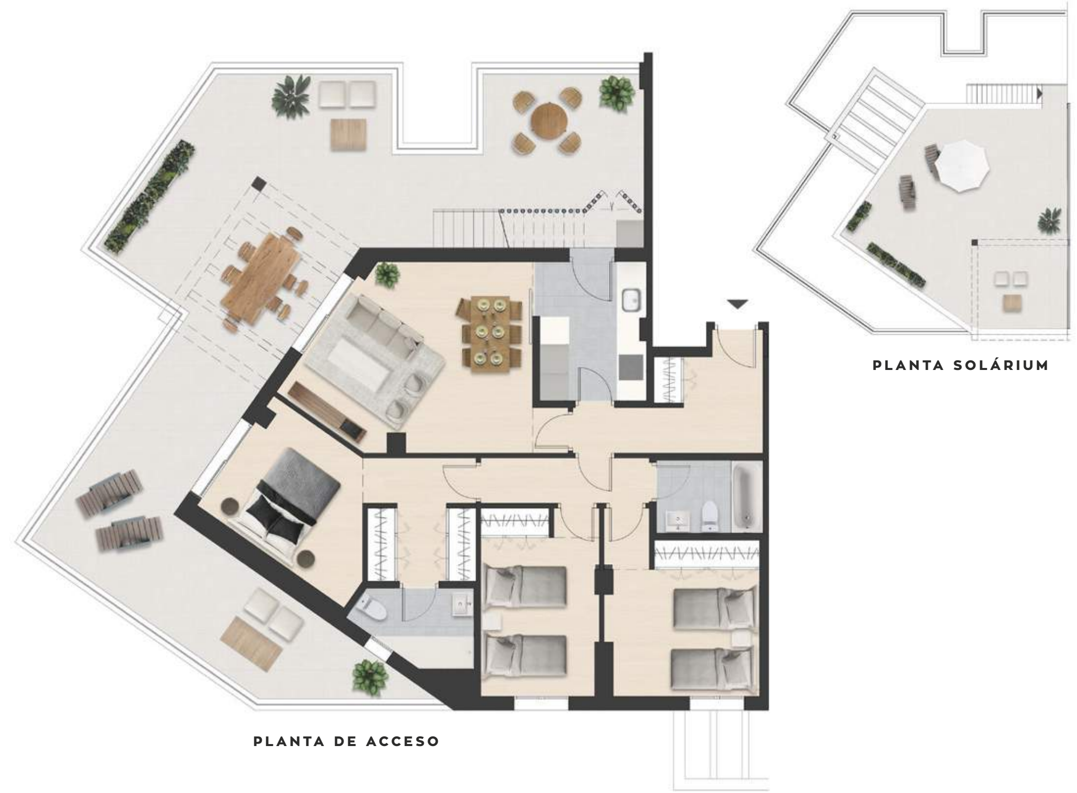
PLANTA DE ACCESO