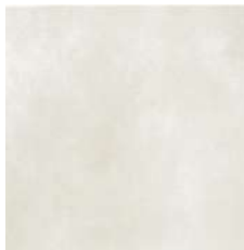
ARGENTA Porcelánico 60x60 cm.