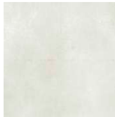
ARGENTA Porcelánico antideslizante 60x60 cm.